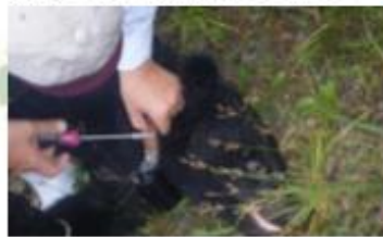
ツキノワグマのGPSによる行動調査

イベントに参加することで、ブナの豊凶調査や発信器を使った行動追跡などの調査を体験することができます。