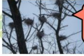
カワウの個体数モニタリング